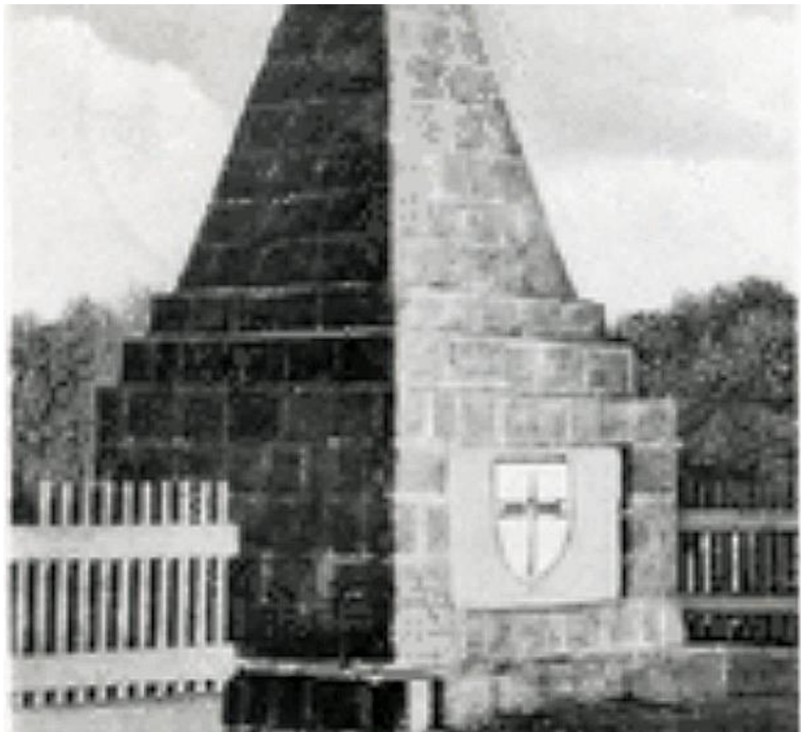
Pomnik plebiscytowy w Gryżlinach