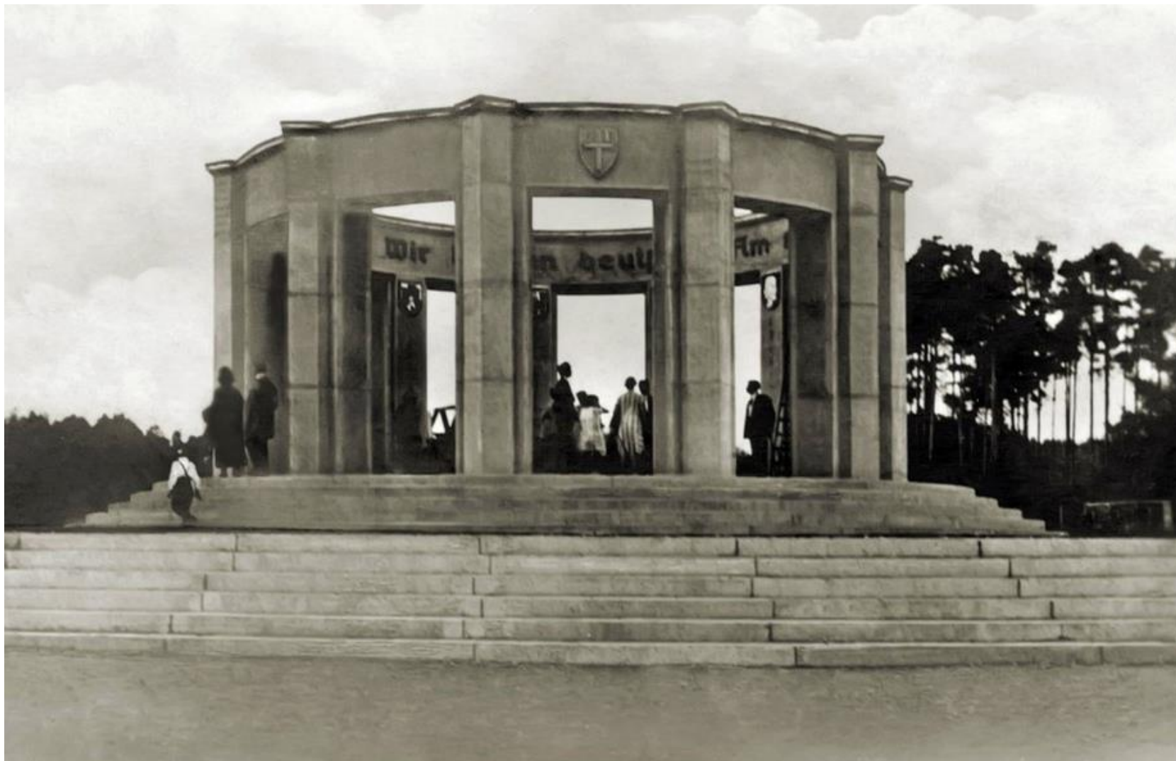
Pomnik plebiscytowy – Olsztyn