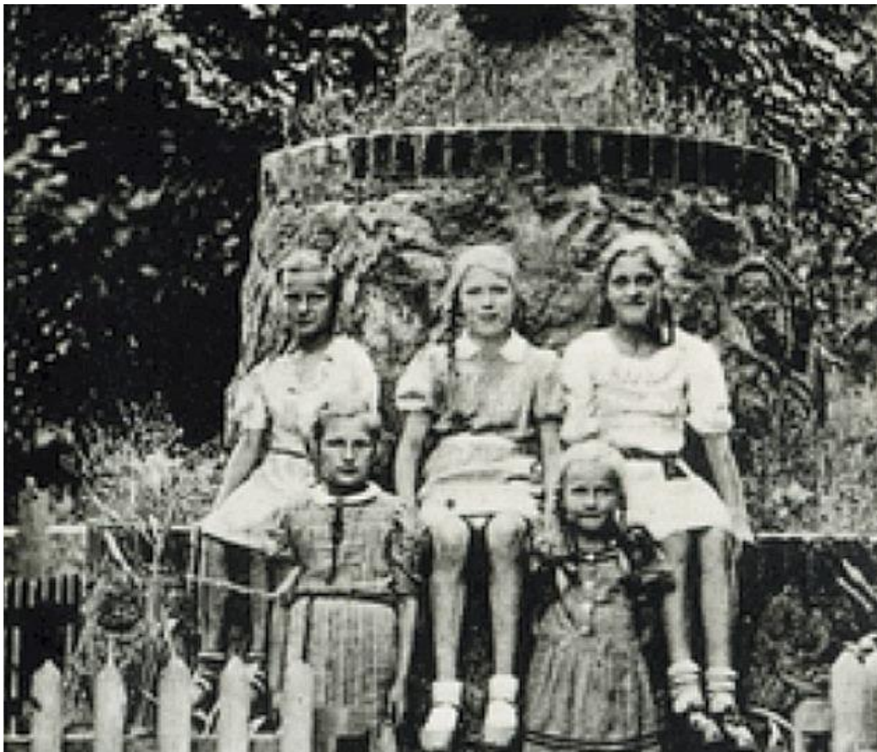
Pomnik plebiscytowy - Boguszewo (niem. Bogunschowen)