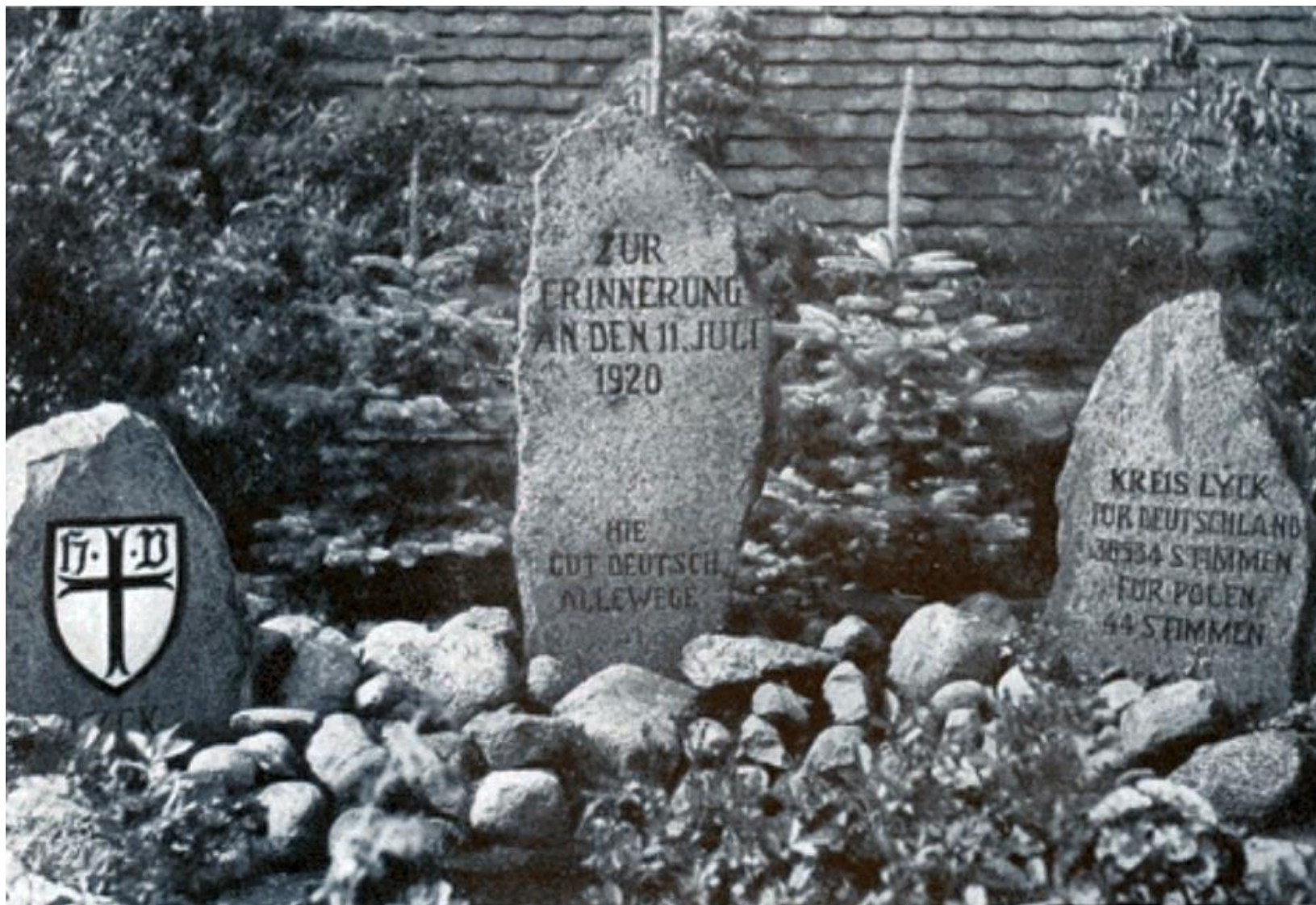
Pomnik plebiscytowy - Ełk - Lyck