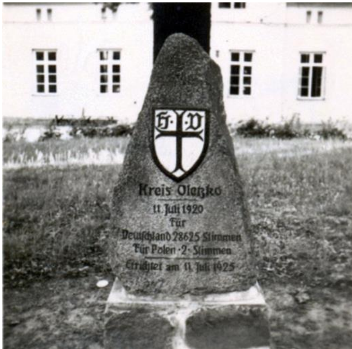
Pomnik plebiscytowy - Prostki (niem. Prostken powiat Olecko)