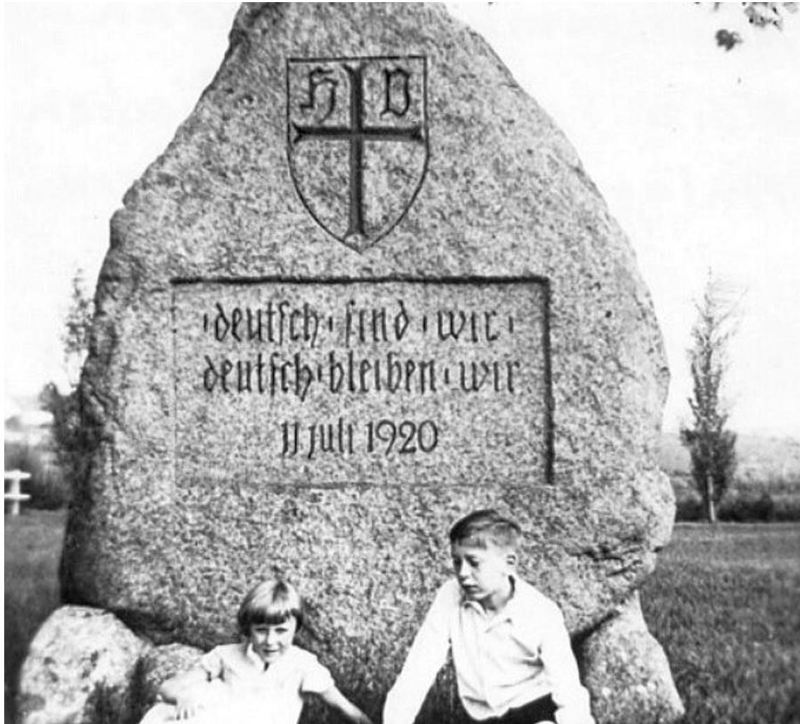
Pomnik plebiscytowy - Bisztynek (niem. Bischofstein)