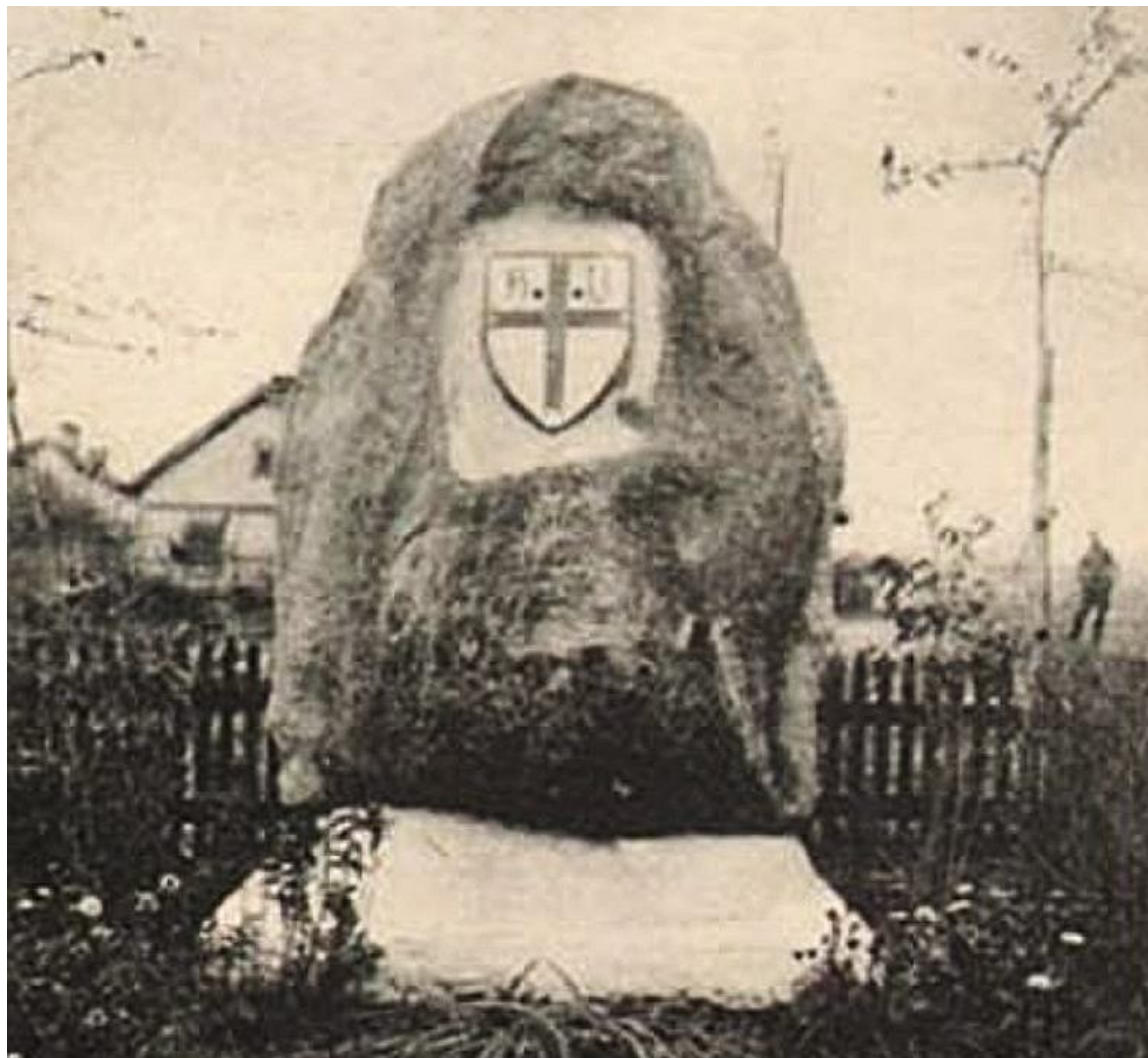
Pomnik plebiscytowy – Pluski